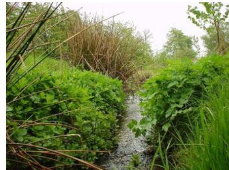
Vandløb ved Anneberg

Det bedste tidspunkt at foretage naturpleje af vandløbet eller grøften er én gang forår og efterår eller én gang midt på sommeren, hvor vandstanden er lav. Her skal du være opmærksom på, at der kan gælde nogle særlige regler for vedligeholdelsen og tidspunktet for plejen af vandløbet eller grøften ved din grund.