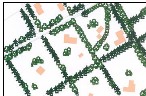
Grunde med lukkede haver og plantede skel

Se på din grund udefra og se på den som en del af et sammenhængende naturområde. Kig ind til naboerne og snak med dem om, hvilket naturindhold jeres grunde har tilsammen. Gå en tur i de fredede eller beskyttede naturområder, som måtte støde op til sommerhusområdet. Få inspiration og ideer til, hvilke naturtyper der engang lå på din sommerhusgrund, og hvilken natur du kan genskabe med den rigtige pleje. Hold et møde i grundejerforeningen eller vejlaugene om udviklingen i jeres område og jeres grundes naturværdier. Find nogle fælles naturværdier, som I ønsker at bevare, beskytte og pleje.