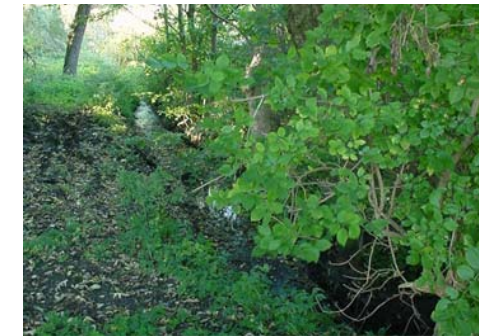
Grøft i sommerhusområde

Har du spørgsmål om vandløbsvedligeholdelse, kan du tage kontakt til din sommerhuskommune i Odsherred.