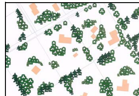
Naturgrunde uden skel og med spredt bevoksning og lysåbne arealer

Klimaet, jordbunden og den tidligere udnyttelse af jorden er med til at begrænse mulighederne for hvilke planter og dyr, der kan overleve på din grund.